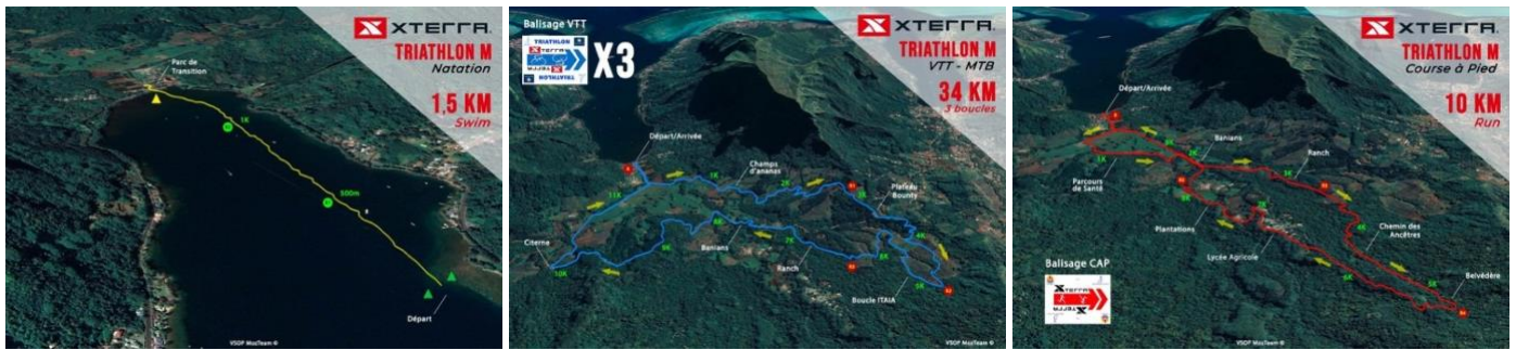
XTERRA TAHITI triathlon format XS